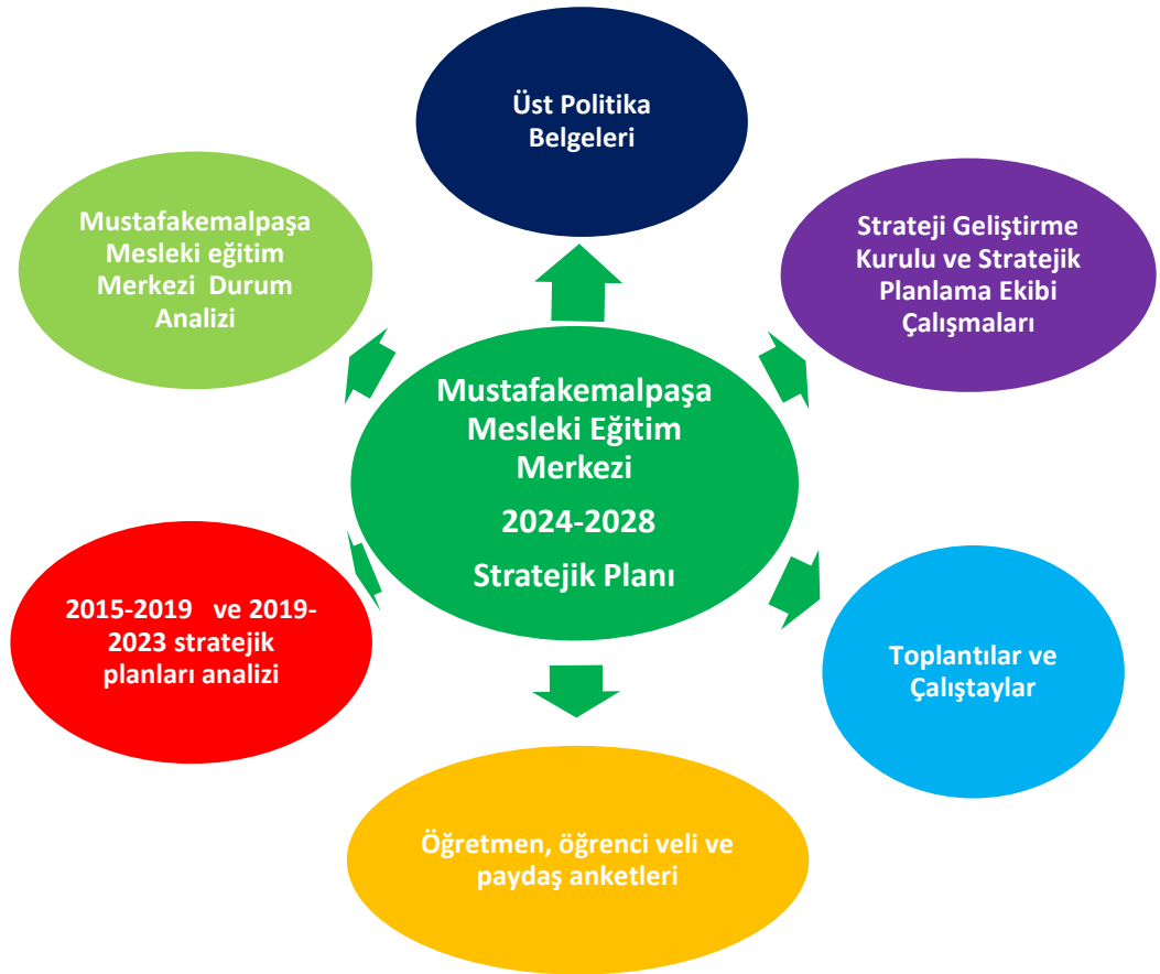
Şekil 2: Stratejik Plan Oluşum Şeması

Mustafakemalpaşa Mesleki Eğitim Merkezi 2024–2028 Stratejik Planı, üst politika belgelerinin analizi, geniş katılımlı çalıştaylar, Stratejik Plan Ekibi çalışmaları, birim önerileri, kurum Müdürlüğü kapsamlı durum analizi raporu doğrultusunda hazırlanmış ve çalışmalar Şekil 2’de gösterilmiştir.